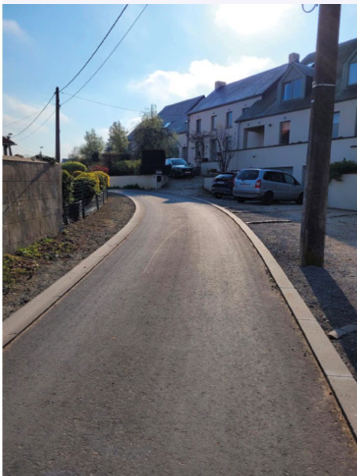
Rue de la Cortaie

Nous tenons à remercier en particulier les habitants de Nethen pour leur patience et leur compréhension durant ces derniers mois.