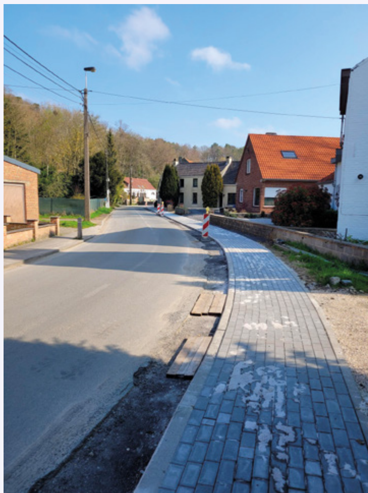
Rue de Hamme-Mille